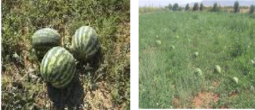
Foto 4. Kâzımkarabekir’de Paşa Karpuzu

Yıllara göre sebzeçilikte de çok fazla bir değişikliğin görülmele yalnızca kabak üretimindeki azalma dikkati çeker. Kabak üretimindeki düşüş gerek tarım müdürlüğü gerekse çiftçilerden alınan bilgiler doğrultusunda ekonomik değerinin az olmasından kaynaklandığı belirtilmiştir. Yine 2003 yılında sebze üretiminde bir düşüşün olduğu görülür (Tablo: 7).