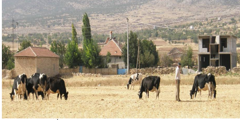
Foto 6. İlçe Merkezinde Otlayan Büyükbaş Hayvanlar

Küçükbaş Hayvancılık: Küçükbaş hayvancılığının 15.167'sini koyun, 1431'i kıl keçisi oluşturur. Koyun yetiştiriciliği genelde köylerde, kıl keçisi yetiştiriciliği ise Hacıibaba Dağı eteklerindeki yörelerde yapılmaktadır. Koyun işletmelerinin % 80'i, keçi işletmelerinin %60'ı 1-50 baş kapasiteli işletmelerdir.